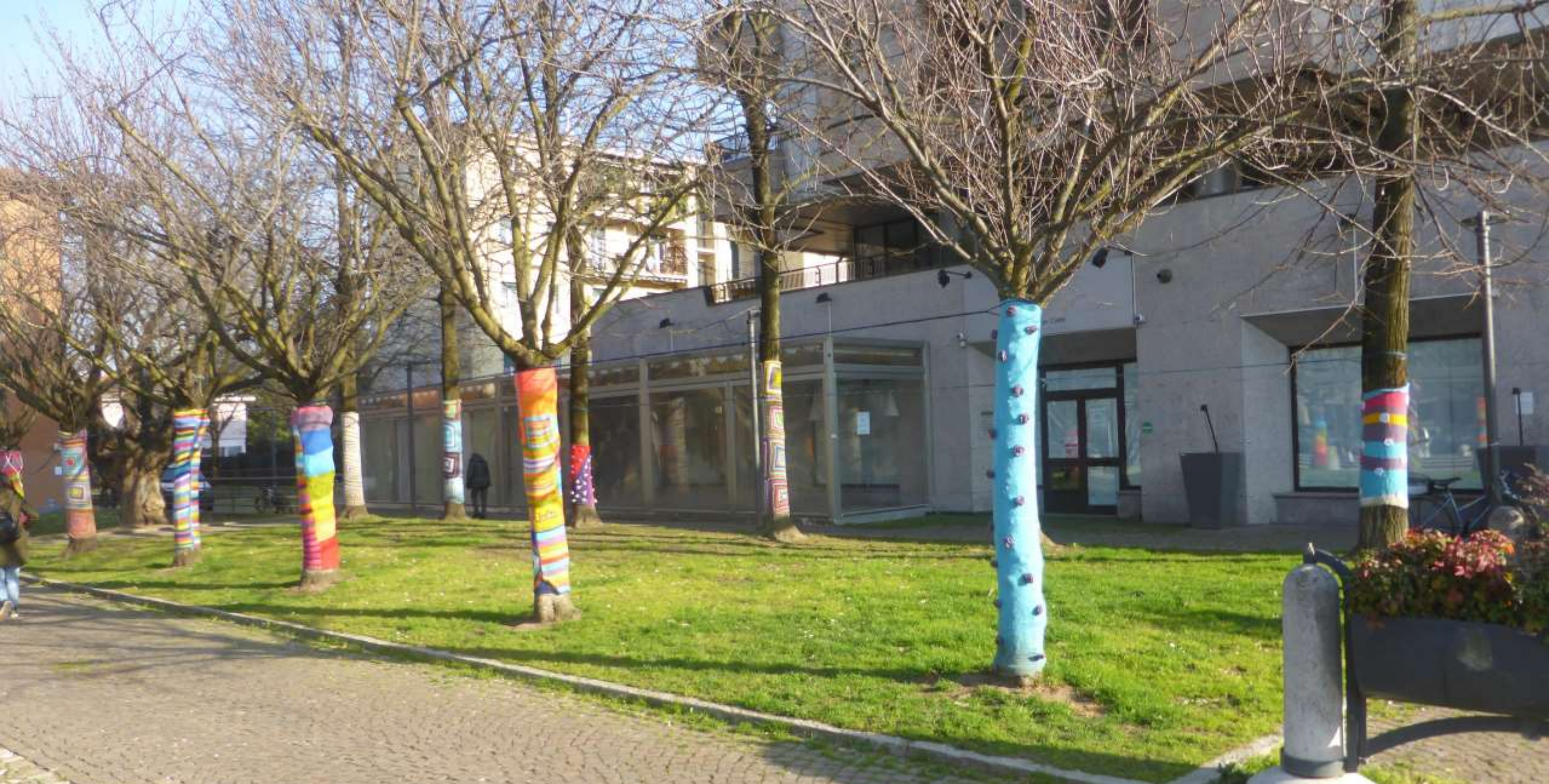
Gli alberi incapottati di Vedano...