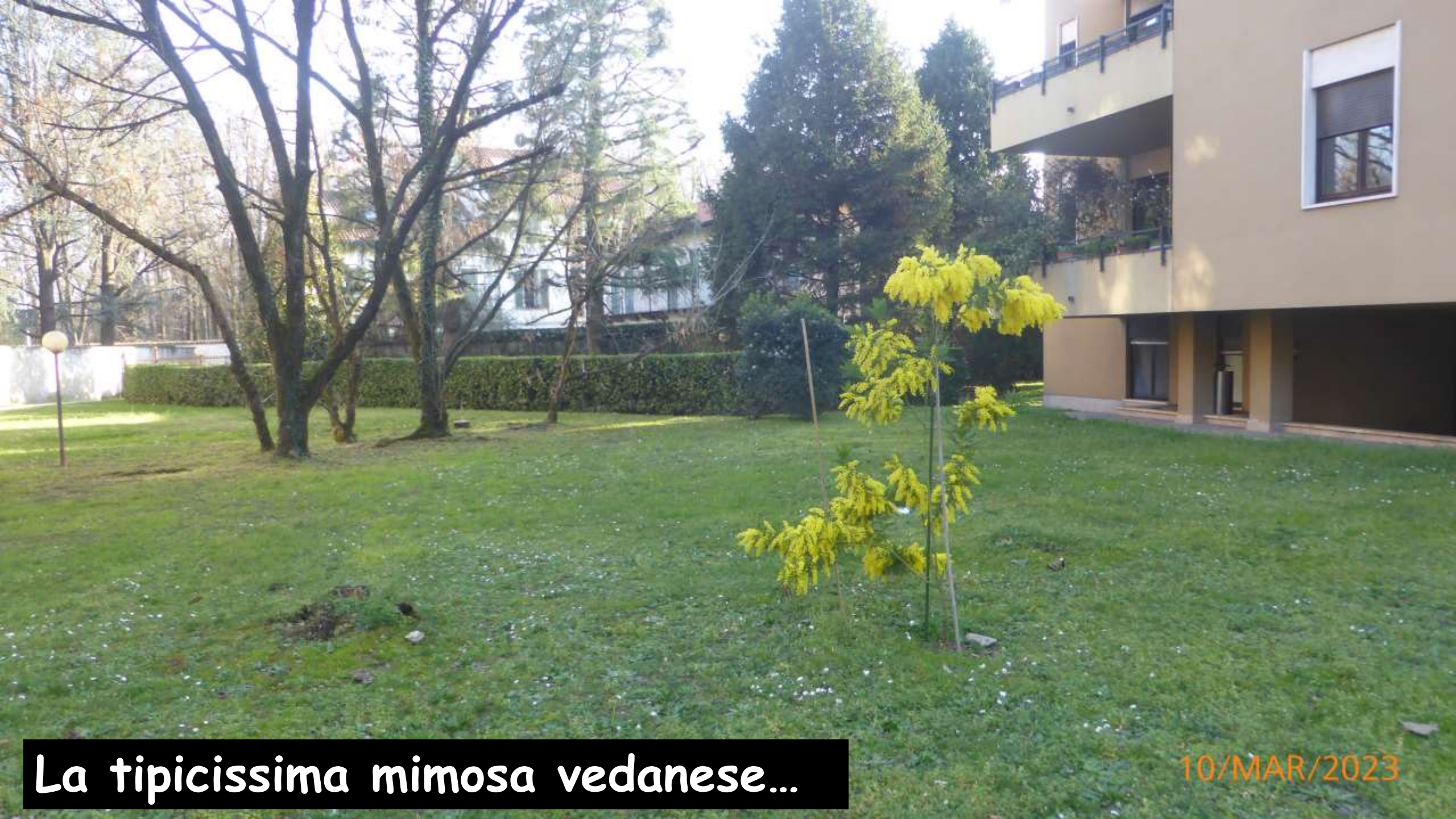
La tipicissima mimosa vedanese...