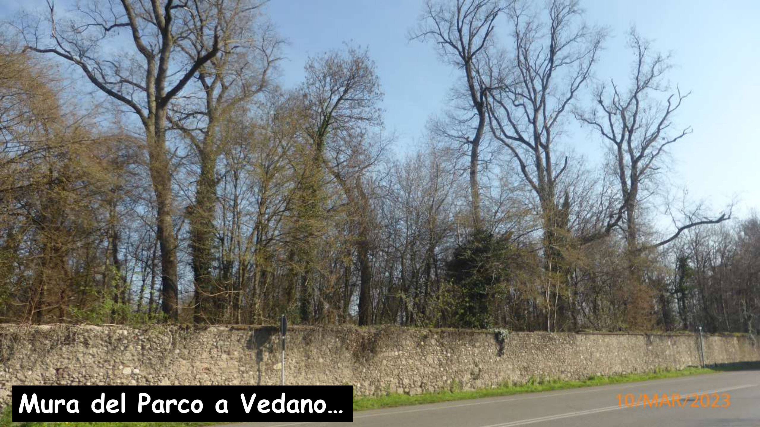
Mura del Parco a Vedano...