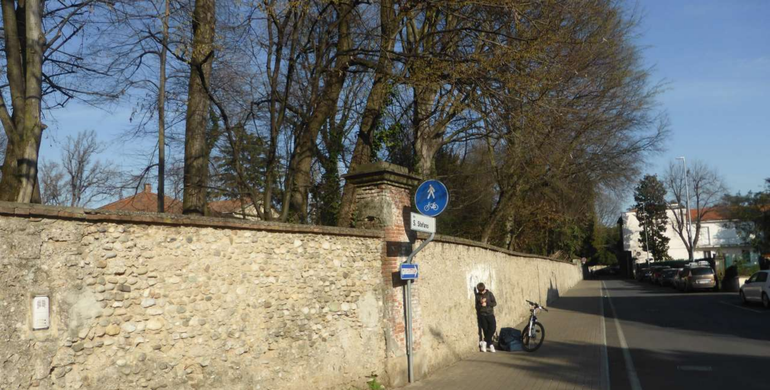
Via Santo Stefano con guardatore di telefonino...