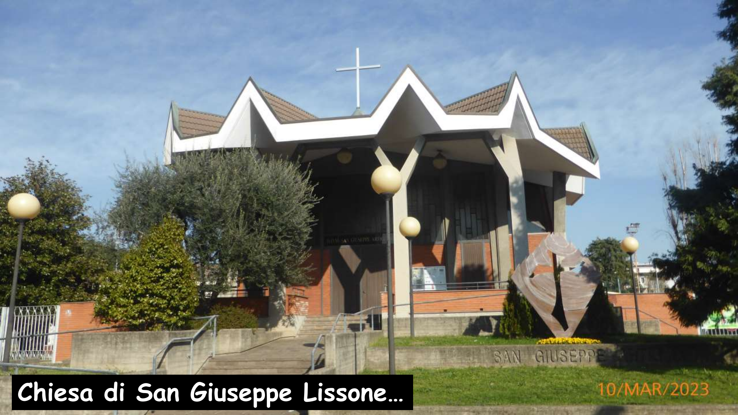
Chiesa di San Giuseppe Lissone...