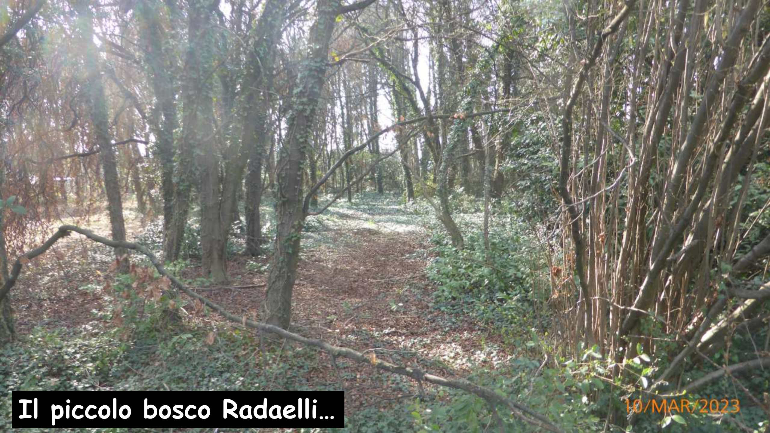
Il piccolo bosco Radaelli...