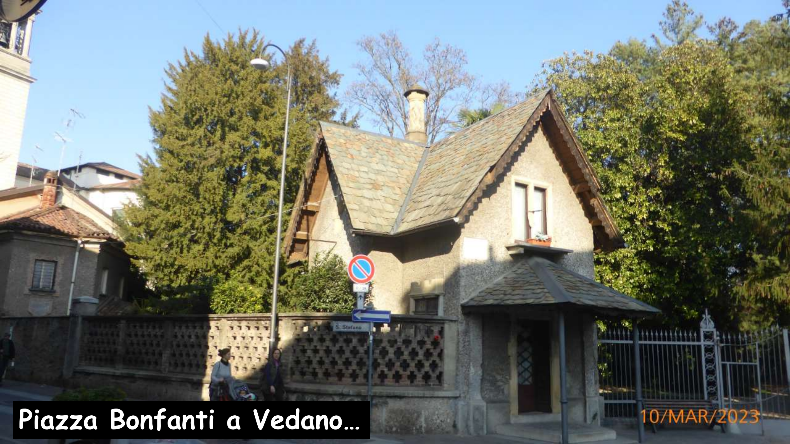
Piazza Bonfanti a Vedano...